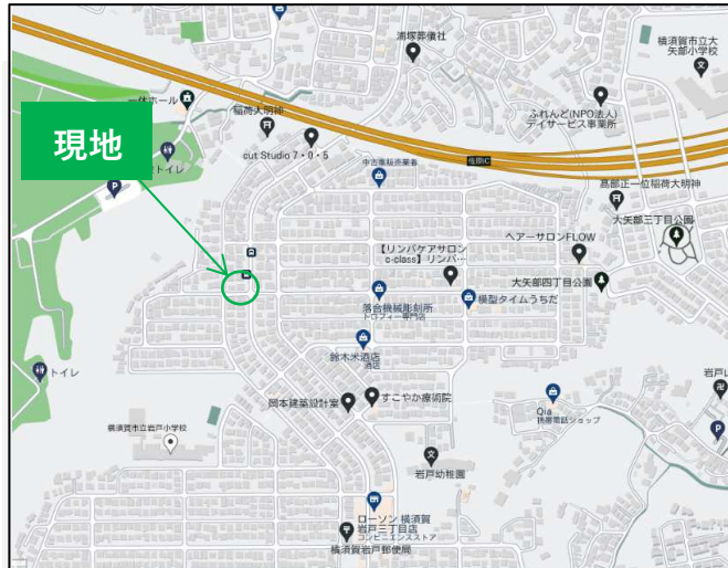
CARNAVI カーナビは「横須賀市大矢部4-5-5」とセット